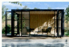
ガーデンルームプラン

プラスGはお庭に素敵な目隠しのシーンを演出し たりガーデンルームを作ったり。自由な発想と組み 合わせて憧れの空間を作ることが出来る商品です。