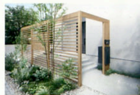
アプローチプラン