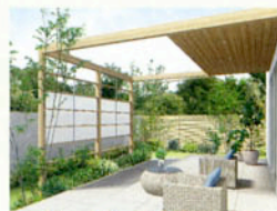
ガーデン目隠しプラン