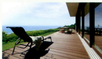
樹ら楽ステージ木彫